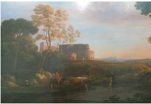
Pastorale avec l'Arc de Constantin , Claude Lorrain, 1648, huile sur toile, Kunsthhaus Zürich

Lors de notre visite, le prêt d'une loupe nous a permis d'apprécier la minutie des dessins et les nombreux détails des paysages et des scènes pastorales ou mythologiques (beaucoup sont réalisés à partir de notes et d'études de la nature et du paysage autour de Rome).