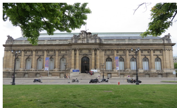
Le musée d'Art et d'Histoire de Genève