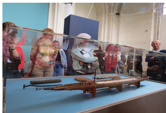
La maquette du chaland long de 31 mètres et une scène de halage