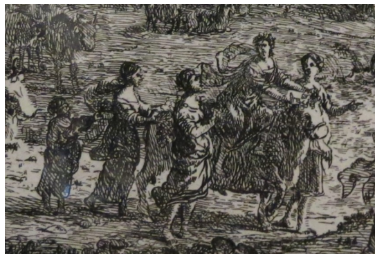
L'enlèvement d'Europe , Claude Lorrain, détail

En sortant de cette visite, nous avons pu profiter du parc en face du musée d'Art et d'Histoire pour pique-niquer en admirant le paysage et attendre la visite commentée de l'exposition « César et le Rhône. Chefs d'œuvre antiques d'Arles » à 14h.