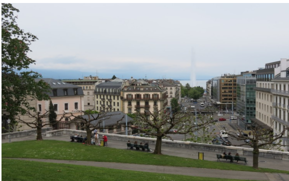
Dans le parc avec vue sur le lac et son jet d'eau

En sortant de cette visite, nous avons pu profiter du parc en face du musée d'Art et d'Histoire pour pique-niquer en admirant le paysage et attendre la visite commentée de l'exposition « César et le Rhône. Chefs d'œuvre antiques d'Arles » à 14h.