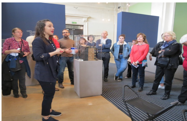
Le groupe et notre guide devant le coffre en bois

L'on a pu y découvrir un coffre en bois renforcé de plaques métalliques, une statuette d'Hercule ou celle d'un captif, mais également des objets qui nous renseignent sur le commerce rhodanien, l'organisation et la diffusion des marchandises ; la statue de Vénus en impose et le buste présumé de César n'a pas fini de faire couler beaucoup d'encre !