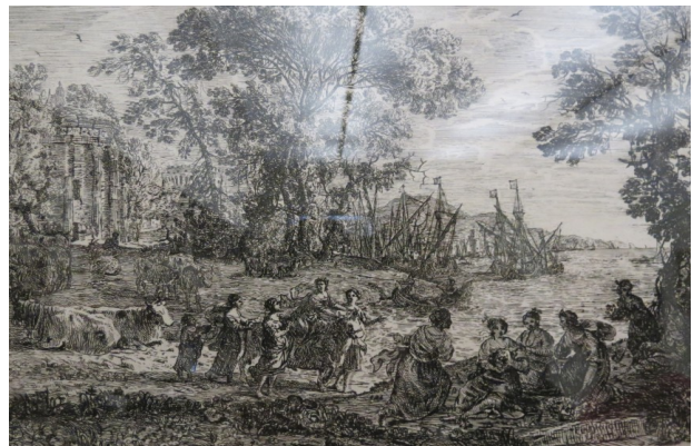
L'enlèvement d'Europe , Claude Lorrain, 1634, eau-forte et pointe sèche, Cabinet d'arts graphiques